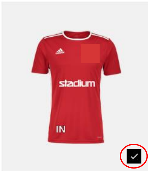
ADIDAS ENTRADA 18 JSY

Valitse kuinka monta kappaletta haluat tilata. Stadium tilaa logoja valitsemasi lukumäärän verran. Jos haluat isomman määrän logoja kuin itse tuotteita, valitse logojen lukumääräksi niiden haluttu kokonaismäärä. Kaikki ylijäämälogot toimitetaan tilaajalle.